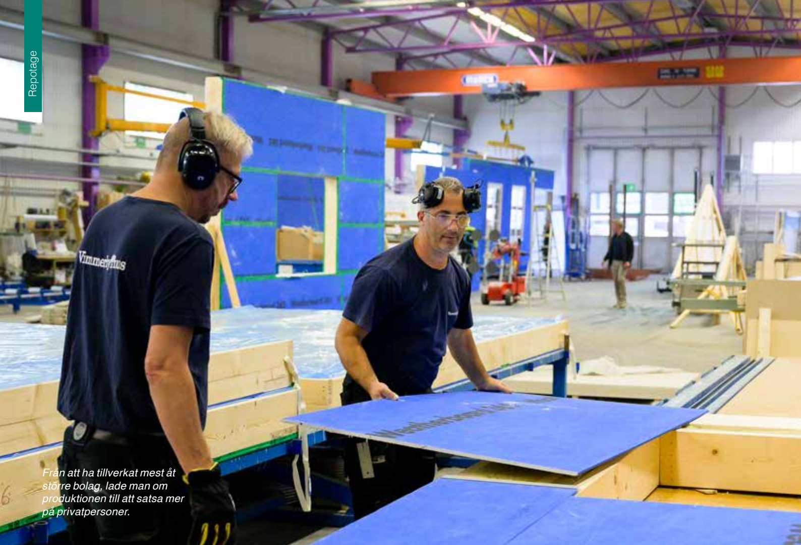
Från att ha tillverkat mest åt större bolag, lade man om produktionen till att satsa mer på privatpersoner.