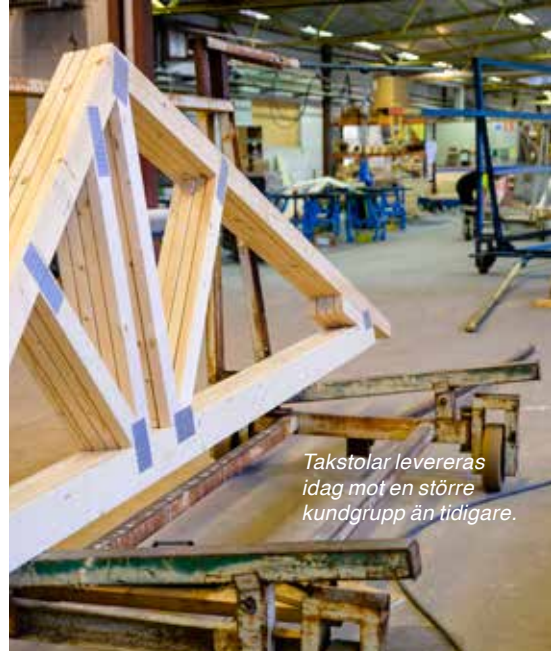
Takstolar levereras idag mot en större kundgrupp än tidigare.