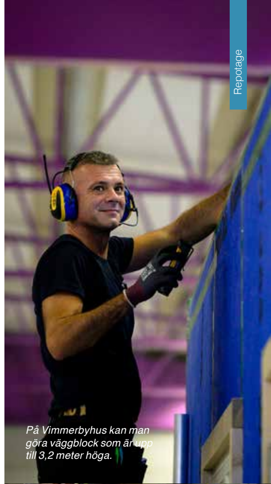
På Vimmerbyhus kan man göra väggblock som är upp till 3,2 meter höga.

– Förr var frågan bara – vad kostar huset? I dag tittar våra kunder mer och mer på den totala boendekostnaden. Vi ser att fokusområden som materialpriser, ränta och energipriser kommer att behöva förändra våra produkter. ■