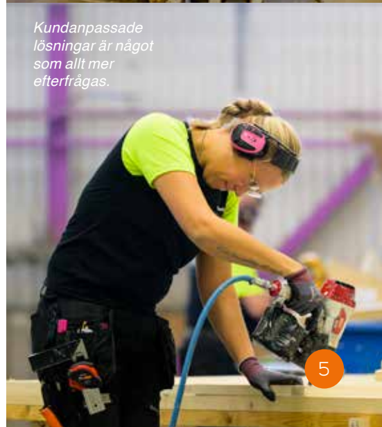
Kundanpassade lösningar är något som allt mer efterfrågas.